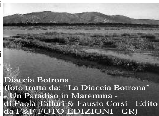
Diaccia Botrona