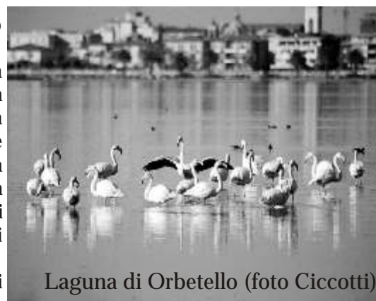
Laguna di Orbetello